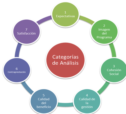
Imagen 1. Categorías de análisis.